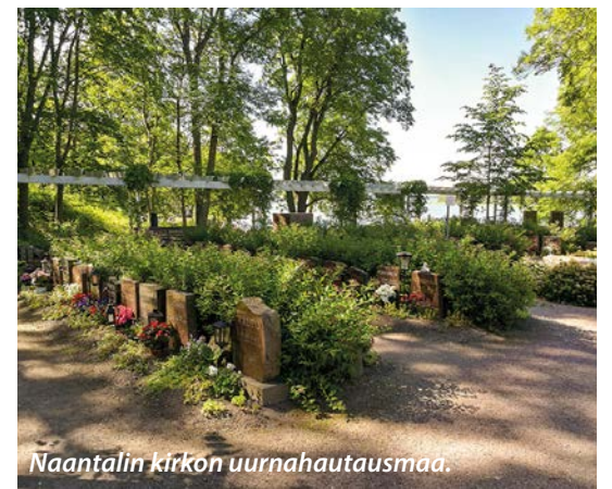
Naantalin kirkon uurnahautausmaa.