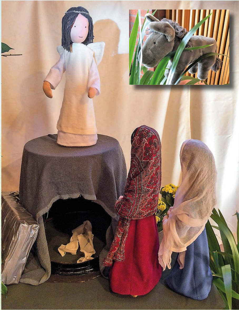
Asetelma näytelmästä "Tyhjä hauta"

Merimaskun seurakunnan työntekijöiden Nukketeatteri ILO työstää uutta näytelmää "Mestarin kaverit". Keppinuket saavat kertoa draaman avulla Jeesuksen ja opetuslasten seikkailuista.